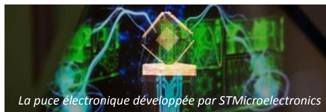
La puce électronique développée par STMicroelectronics

STCOMET intègre sur une seule puce plusieurs fonctions nécessaires au compteur communicant : un moteur de traitement de signal CPL dédié et entièrement programmable, certifié pour la gestion du protocole G3 PLC, ainsi qu'un processeur de traitement des informations basé sur la technologie ARM® Cortex™-M4 avec mémoire Flash programmable et mémoire RAM, un convertisseur analogique/numérique de haute précision ainsi qu'un module de sécurité. De plus, sa flexibilité permet de la reconfigurer à distance pour intégrer la prise en charge de futures évolutions des protocoles de communication.