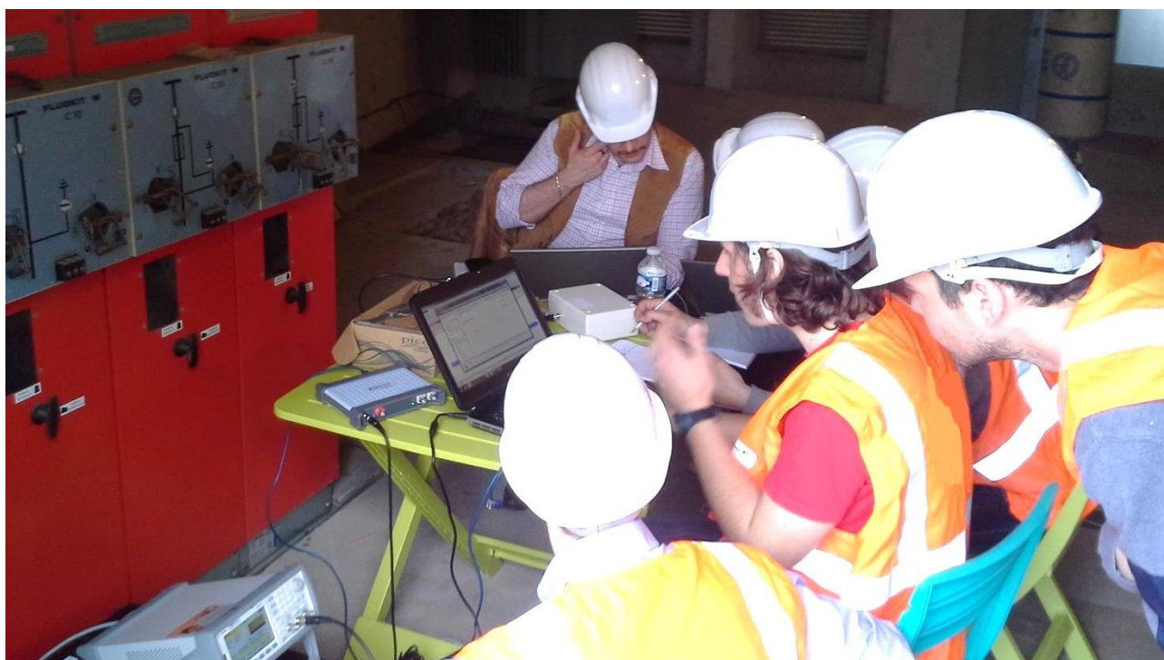
Phase de test SOGRID à Toulouse par les équipes ERDF, été 2015