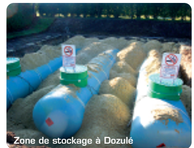
Zone de stockage à Dozulé

Le tableau, ci-dessous, donne l'état d'avancement des trois délégations de service public au regard des objectifs fixés dans les cahiers des charges.